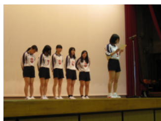
女子バレーボール部