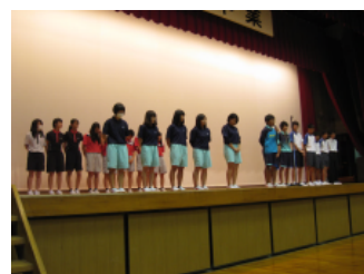
ソフトテニス部（男女）