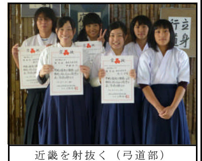
近畿を射抜く (弓道部)