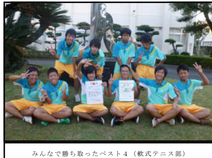
みんなで勝ち取ったバスト4 (軟式テニス部)