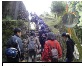
さあ、古道を歩かず

11/11 (月) 2 学年全員がESD教育の一環として田辺市本宮にてフィールドワークを行いました。当日は、三軒茶屋から本宮大社までの熊野古道を歩き、世界遺産での体験活動を行いました。地域に根ざした伝統文化や地元の人びとと触れあう中で、人と自然、人と人との共存や多様な生き方を学ぶことができました。