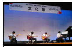
音楽部による演奏