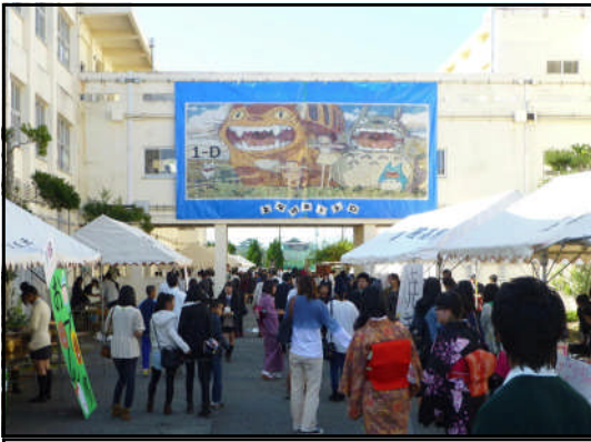
今年もバザーは大盛況