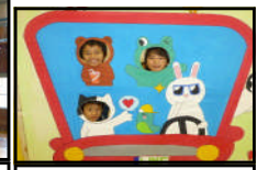
来年もまた来てください