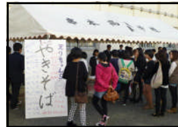
やきそばをどうぞ