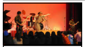
有志によるロックバンド