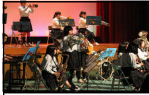
吹奏楽部によるオープニング