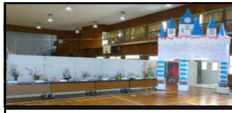
ディズニーゲートと華道部作品