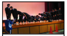
スポーツ選抜生による演技

台風の接近により、10/27(日)・28(月)に延期された文化祭でしたが、多くの方にご来場いただき、無事開催することが出来ました。吹奏楽部のファンファーレで始まった文化祭でしたが、 ステージ発表部門 は、吹奏楽部、音楽部、音楽選抜生による舞台発表、スポーツ実践選抜生による『集団行動2013』の演技等が行われました。恒例のヒットスタジオではダンスや歌、先生方のコントや歌の披露も行われました。また、生徒たちが趣向を凝らして制作した映像作品の鑑賞も行われました。ロックコンサートでは2つのバンドの演奏があり、観客の皆さんからの声援を受け、みんなで盛り上がりました。 展示・アトラクション部門 では書道、華道、美術の作品展示や自然科学、商業部の研究発表をはじめ、各クラスのアトラクションや展示作品の力作が目を引きました。また、今年度も防災学習を活動の柱に取り組んでいる生徒会が『かまどベンチ』を使って、避難時に使えるよう「模擬サバイバル炊き出し訓練」としてスープを調理し、提供しました。毎年盛況の バザー部門 は「おでん」「うどん」「フランクフルト」「焼き鳥」「ベビーカステラ」「焼肉」「チュロス」「焼きそば」「たません」「チョコテラ焼き」等のクラス販売が行われました。また、茶道部は「お茶席」、家庭部は「お菓子」、生徒会は「型抜き&わたあめ」、歴史文芸部はイラスト集や菓の販売等を行いました。1日目の日曜日には育友会からカレーライスの販売があり、好評を博しました。