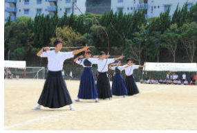
クラブ紹介(弓道部)