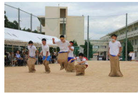
障害物パン食い競争