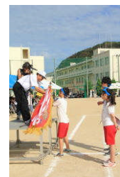
優勝旗は青ブロックへ