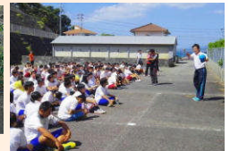
津波でんでんこの精神で

集合している状態で、予告せずに避難訓練を実施しました。2,3年生はバックネット裏から、1年生は裏山から、雇用促進住宅裏の駐車場に避難しました。今回の避難訓練は、南海トラフ大地震の被害新想定が発表されてから2回目のもので、その想定によると串本町内は最大で5.8メートル浸水すると言われています。生徒一人ひとりが日頃から避難場所を意識した行動が望まれます。