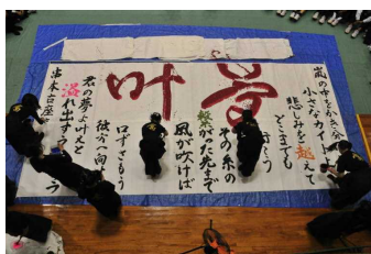
書道パフォーマンス