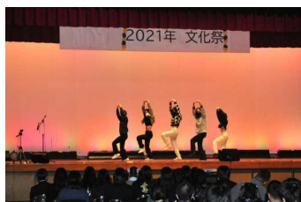
ダンスパフォーマンス