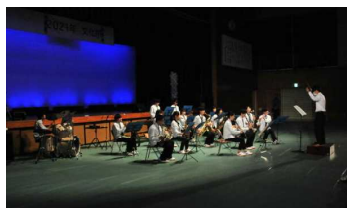
吹奏楽部オープニング演奏