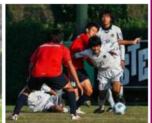
大学時代の写真(30番の選手)